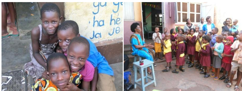
Kinder und Mitarbeiter im Mama Jane C.C.C.