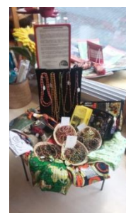
In Deutschland: Verkauf von Kunsthandwerk des Mama Jane C.C.C. im Eine Welt Laden