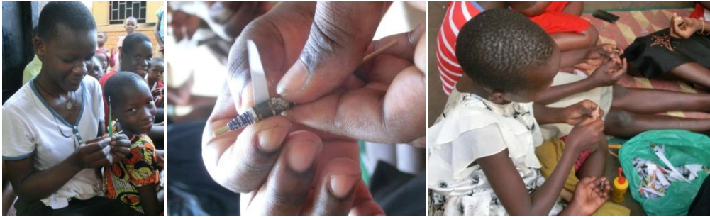
Kinder beim Perlen wickeln