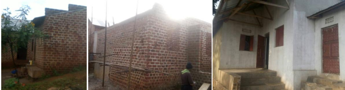
Renovierung des Gebäudes für die älteren Kinder: Vorher, Umbau, Nachher