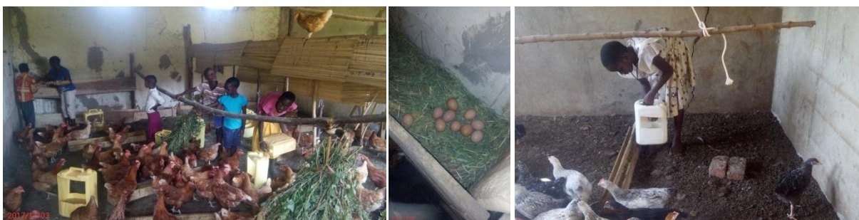
Die neu aufgebaute Hühnerzucht